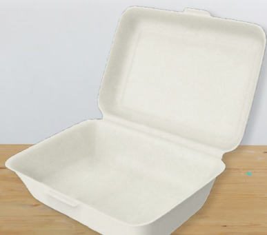
Clamshell Rectangulaire 1 compartiment