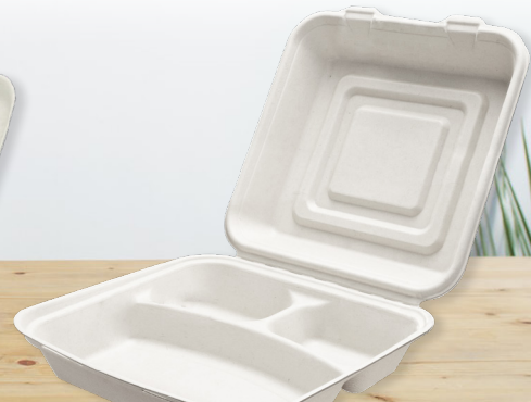
Clamshell Rectangulaire 3 compartiments