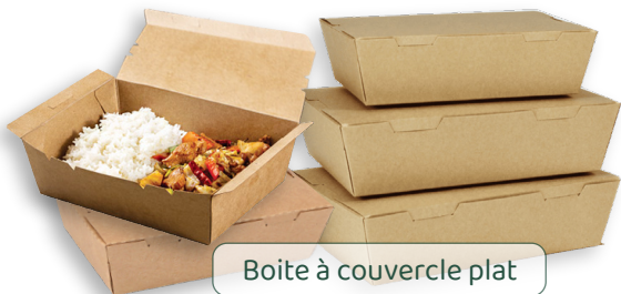
Boite à couvercle plat