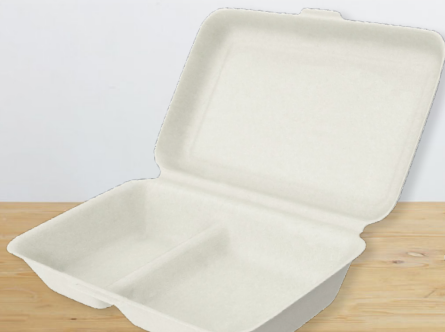
Clamshell Rectangulaire 2 compartiments