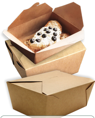
Boite à couvercle en étoile