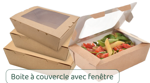
Boite à couvercle avec fenêtre